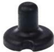
PROTOS® BT-COM BOUTON VOIX SUR L'ÉPAULE